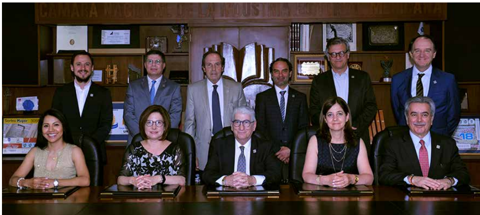
Integrantes del Consejo Directivo 2018-2019.