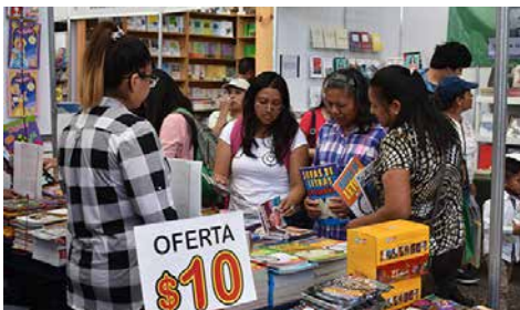
El Auditorio Nacional es la sede del Gran Remate de Libros.

Esta fiesta de las letras conmemoró los 100 años del nacimiento del escritor Juan José Arreola (1918-2001), y de los poetas Alí Chumacero (1918-2010) y Guadalupe “Pita” Amor (1918-2000). Además, se reconoció en vida la obra de Amparo Dávila, y se recordaron a los escritores