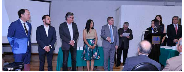
Tomada de protesta de los consejeros para el periodo 2018-2020.